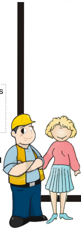
Trabajador (a) recién casado (a)

Revisa tu documentación; te entrega tus documentos orinales, llena y te da el formato (AGM-01) "Solicitud de Ayuda para Gastos de Matrimonio"