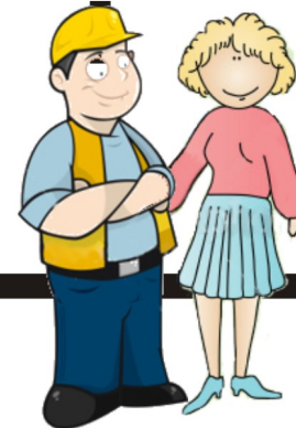
Trabajador (a) recién casado (a)

Debes llenar y entregar: original y copia de la "Solicitud de transferencia o disposición de recursos", y de los siguientes documentos, para cotejo: resolución de ayuda para gastos de matrimonio entregada po el IMSS; cualquier documento que compruebe tu registro en tu Afore, y tu identificación con fotografía y firma