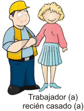
Trabajador (a) recién casado (a)

Debes presentar original y copia: cualquier documento que contenga tu número de Seguridad Social, copia certificada de tu acta de matrimonio, y algún documento que compruebe tu registro ante tu Afore