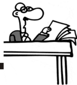
Prestaciones Económicas de tu clínica familiar