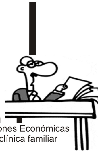
Prestaciones Económicas de tu clínica familiar

Sellan tu solicitud y te entregan una copia junto con tus documentos originales, y pone a tu disposición el importe de 30 días de salario mínimo del DF (actualmente $1,517.10)